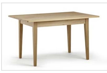
Vierfüßtisch Mod. 9710