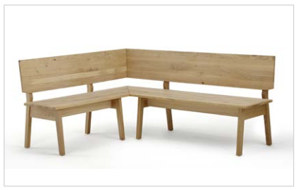
Mod. Falun, Sitz/Lehne massiv