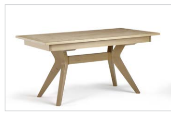
Vierfüßtisch Mod. 9510