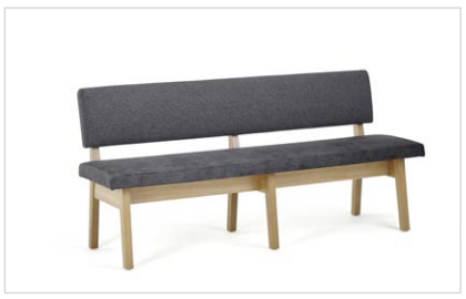
Mod. Falun, Sitz/Lehne gepolstert