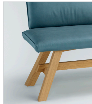
CAB23 Holgestell mit Steg