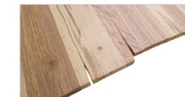
Ausführung stirnseitige Versatzkante

Versatzkante: stirnseitiger Versatz der Platte ohne Kittung. Nur bei Bauntisch Arbon 200 möglich.