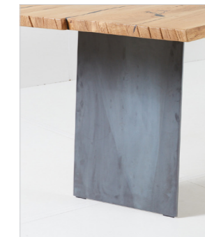
CAT29 Metallwange geölt