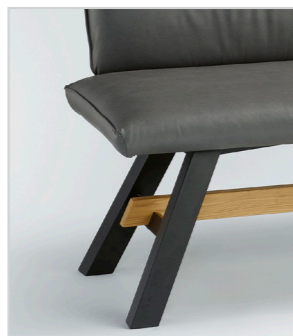
CAB24 Metallgestell pulverbeschichtet mit Holzsteg