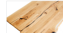
Kittung der Mittelfuge entlang der Holzmaserung