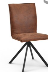
Stuhl Mod. CAS1210 mit Kedernaht, mit 360° Drehfunktion Metallfüße pulverbeschichtet schwarz