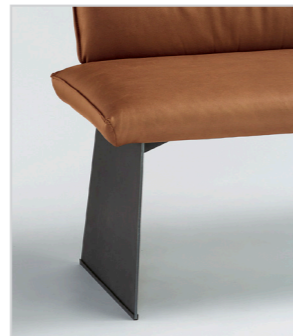
CAB16 Metallwange geölt