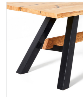
CAT28 Metallgestell pulverbeschichtet mit Holzsteg