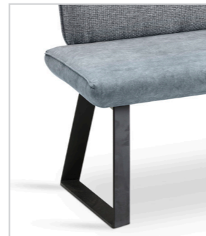
CAB25 (Metalkufe pulverbeschichtet schwarz)