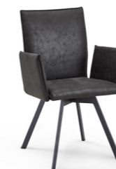
Stuhl Mod. CAS138 mit Kedernaht, mit Drehfunktion, Metallfüße kantig