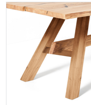
CAT27 Holgestell mit Steg