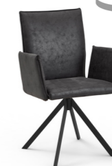
Stuhl Mod. CAS1310 mit Kedernaht, mit 360° Drehfunktion Metallfüße pulverbeschichtet schwarz