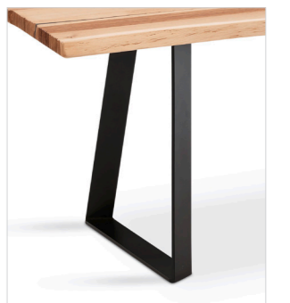
CAT31 Metallgestell pulverbeschichtet schwarz