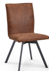
Stuhl Mod. CAS128 mit Kedernaht, mit Drehfunktion, Metallfüße kantig