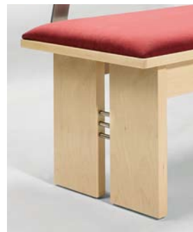
Fuß GH mit Edeltstahlhülse Wange C