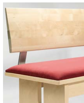
Lehne 3 Holzlehne glatt