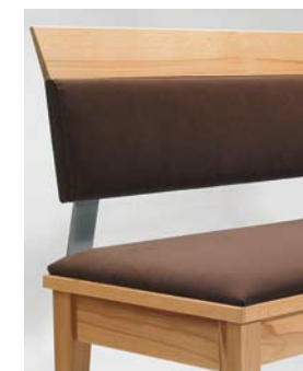
Lehne 1 Teilpolsterlehne