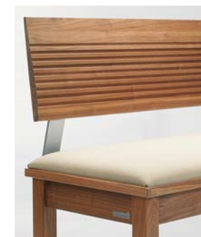
Lehne 2 Holzlehne mit Rillenfräsung