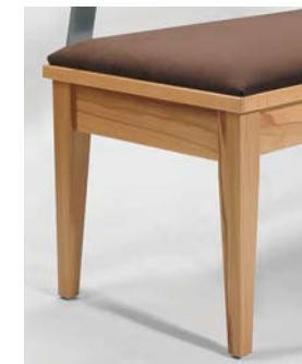
Fuß K (konisch)