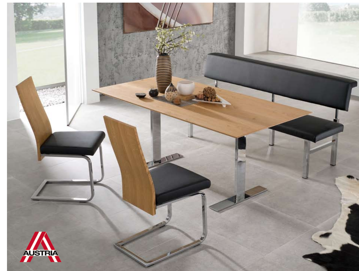
Abbildung: In Splintnuss dunkel lackiert, Chrom glänzend als Eckbankgruppe, Wangentisch Mod. Wallis-F, Platte furniert, ohne Auszug Freischwinger Mod. 47 Bezug: Torero 5098 weiß (Lederoptik)