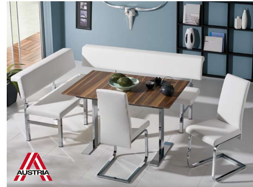
Abbildung: In Splintnuss dunkel lackiert, Chrom glänzend als Eckbankgruppe Wangentisch Mod. Wallis-M, Platte massiv mit Klappeinlage (50 cm) Freischwinger Mod. 47 Bezug: Torero 5098 weiß (Lederoptik)