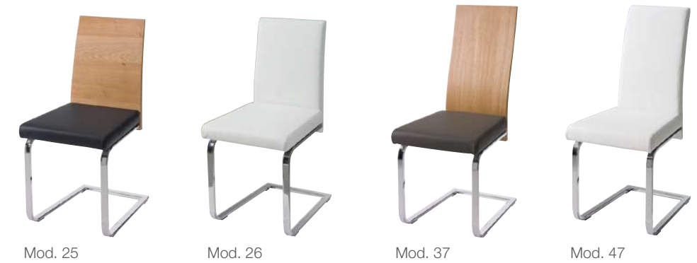
Mod. 25 Mod. 26 Mod. 37 Mod. 47

✓ Klappeinlage (50 cm) zu Tisch Mod. Wallis-M bzw. Wallis-F